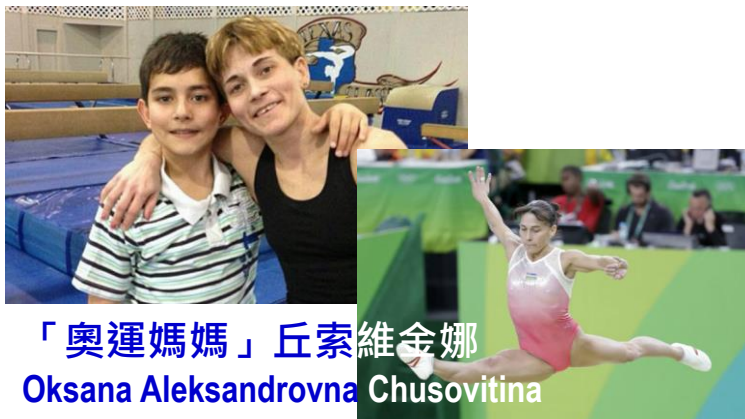
「奧運媽媽」丘索維金娜 Oksana Aleksandrovna Chusovitina