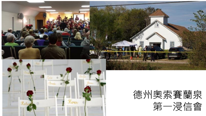
德州奧索賽蘭泉 第一浸信會

📖 我們既因信稱義，就藉著我們的主耶穌基督得與神相和。2 我們又藉著他，因信得進入現在所站的這恩典中，並且歡歡喜喜盼望神的榮耀。(羅馬書 5:1-2)