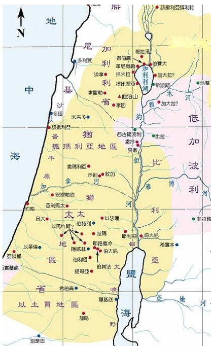
革尼撒勒湖/提比利亞海/加利利海